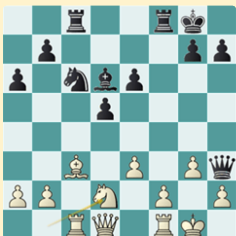
Análisis tras 21.Cd2

La partida podría haber continuado 18...Cg5 19.Ag2 Ch3+ 20.Axh3 Dxh3 21.Cd2