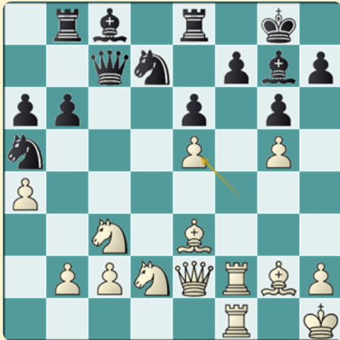
Análisis después de 22.fxe5

21.e5!! dxe5 (21...d5 es más prudente pero admite una inferioridad.) 22.fxe5 El peón queda a tiro de tres piezas negras aunque ninguna captura es recomendable.