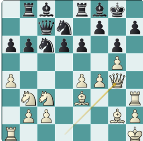
Posición temática en esta variante

Esto nos lleva al debate de siempre, ¿es mejor ir directo al objetivo o conviene preparar bien las cosas? En cada caso la respuesta es la misma, "depende".