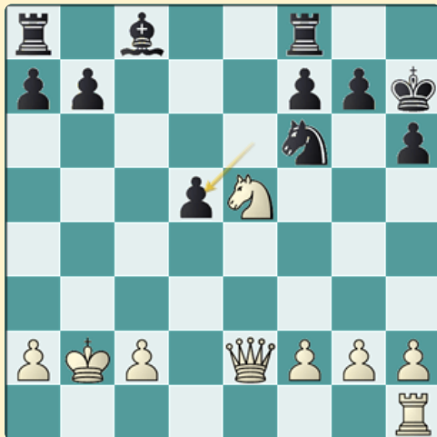
Análisis después de 19...exd5

Como alternativa, citar que existe aquí la secuencia 16...Axc3 17.Ah7+ Rxh7 18.Txd5 Axb2+ 19.Rxb2 exd5. Que yo sepa, nadie nunca jugó así y pienso que esta posición es mejor que el final.