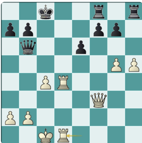
Análisis después de 28.Ted1

Esta jugada no es un técnicamente un error como tal porque las blancas siguen estando milimétricamente mejor, pero es dudosa porque habían varias alternativas mejores, entre las cuales destaca 23.Cb5! Db6 24.c4 d4 25.Df3 Taf8 26.Cxd4! Cxd4 27.Txd4+ Rc8 28.Ted1