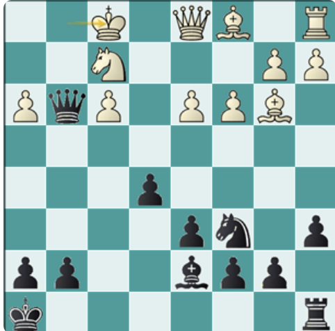
Análisis después de 19.Rf1

He encontrado unas notas que elaboré después de la partida, en la habitación del hotel. Las incluyo aquí para ilustrar los errores que se cometían en ese análisis manual.